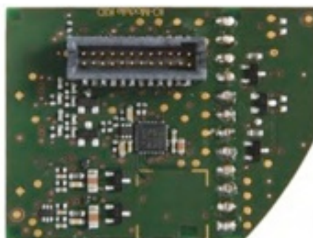
右：黒のカメラソケットが付いた裏側