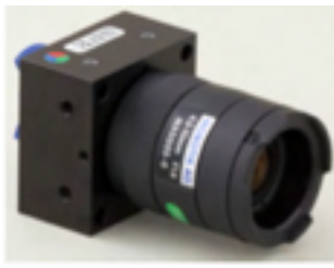
CSマウント+CSVarioレンズ搭載