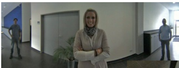
180度パノラマ映像(Grandstream上の映像)