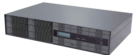
電源シングルモデル (MX206N5S12) 奥行きが短いのでラックマウントも据え置きも可能!