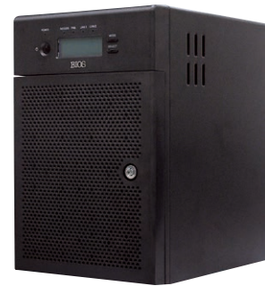
RAID6対応 デスクトップNAS (PS306NAS) 監視カメラに最適なハードウェアRAID搭載ネットワークストレージ!