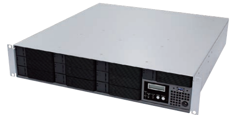
堅牢性な電源2重化モデル (EM2210NX12) 信頼性の高いハードウェアRAID6採用!