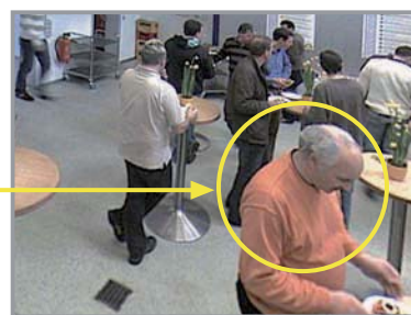
デジタルズーム/パン/チルト